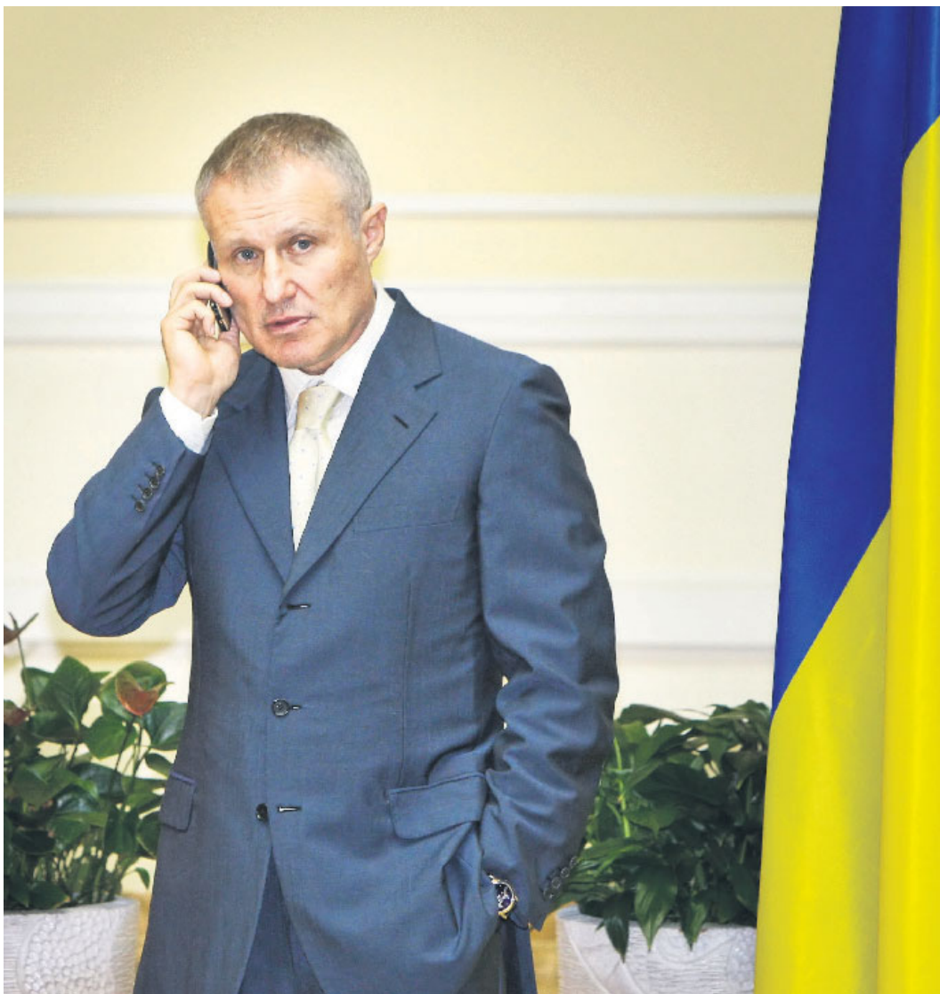
Soerkis doet een belletje naar zijn FIFA-vrienden.

Meer voorbeelden? De Tsjetsjeense machthebber Kadirov koopt een