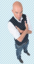
Tommy Wieringa is auteur van onder meer de roman Caesarion .