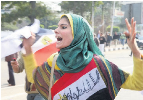
Ook vrouwen gaan de straat op in Caïro.

Zo denkt 58 procent van de jongeren (!) dat mannen beter zijn in hun werk dan vrouwen en vindt 87 procent dat mannen meer recht hebben op een baan dan vrouwen. En 70 procent ziet liever een man dan een vrouw als politiek leider.