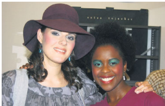
Tussen het netwerken door, even poseren voor de camera.

Wat mij echter het meest is bijgebleven van de speech van Ruud is the message : met volledige overgave en oprechtheid een doel nastreven dat groter is dan alleen eigenbelang, zo zorg je ervoor dat fundamentele zaken samenkomen. Mensen die essentieel blijken voor het realiseren van je dromen komen op je pad. Alles lijkt opeens als vanzelf op zijn plek te vallen. Onlangs las ik dat dit fenomeen ook wel synchronicity wordt genoemd. Hoe het ook moge heten, het achtervolgt ook mij sinds ik met duurzaam ondernemen ben begonnen. Commitment is wat samenbrengt en Twee voorbeelden wil ik graag met u delen: duurzame